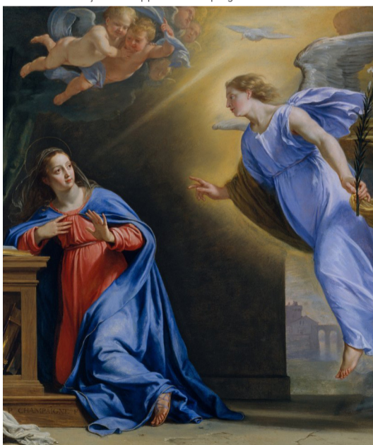
Foto: A anunciação - Philippe de Champaigne

Maio chegou, o Mês mariano. Mas maio, além de devoção, é um convite a algo mais profundo: aprender, com Maria, o que significa entregar.