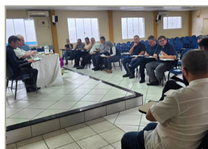
Reunião do CARP