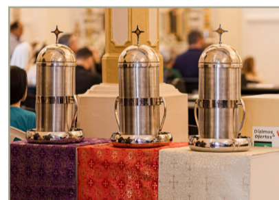
Missa do Crisma