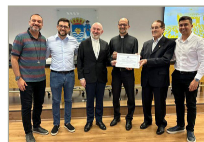
Moção de Aplausos para Rádio Divino Oleiro