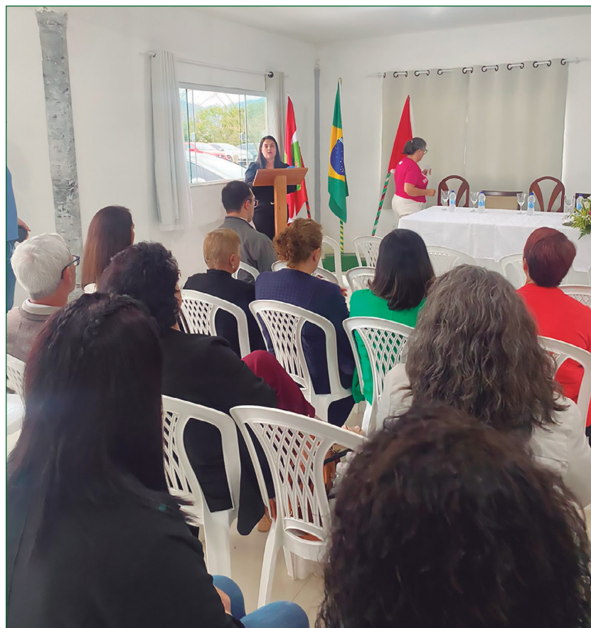
Reunião da Associação de Combate ao Câncer, de Palhoça, no Recanto São Francisco.

O Recanto São Francisco , localizado no bairro Alto Aririú – Palhoça é um espaço destinado para encontros, reuniões, retiros e capacitações. No ano de 2022, foi dado continuidade na obra, no piso superior onde estão localizados os quartos. Neste ano também foi constituído uma coordenação para o Recanto, com representantes da comunidade local, Pastoral do Povo de Rua e ASA. Um destaque deste ano, foi o início da Comunidade Divino Espírito Santo que está utilizando o Recanto para fazer suas celebrações. Também foram realizados encontros formativos da Pastoral do povo de Rua e para acolhimento de pessoas em situação de rua que estão iniciando o processo junto ao projeto Moradia Primeiro.