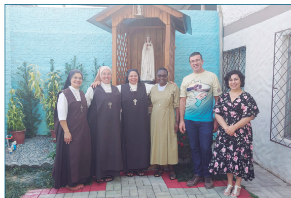
Visita à Entidade Renascer, em Joinville.