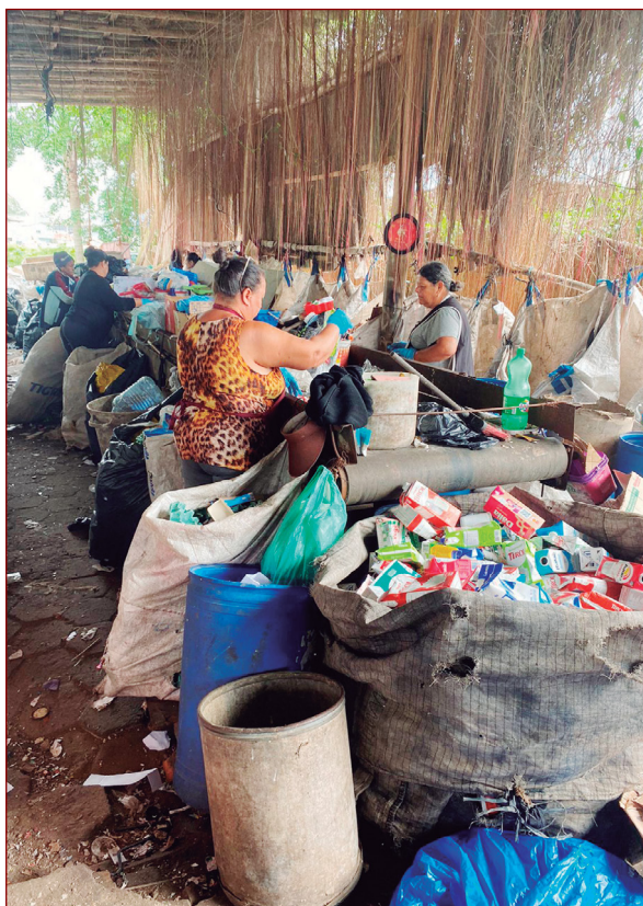
Projeto Acreli: reciclagem.