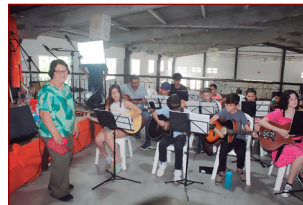
Participação em Formatura.