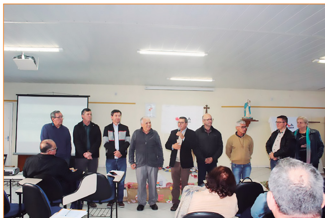
Diretoria da ASA.