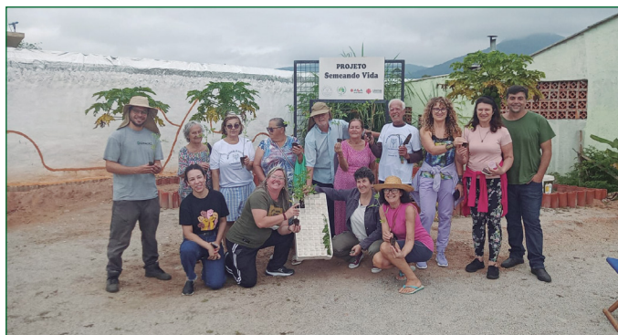
Projeto de Horta Comunitária.

O Projeto MAGRE atua em temáticas ligadas à prevenção de desastres, atendimento emergencial aos indivíduos e famílias afetadas e na construção de comunidades mais seguras e resilientes. Promove e fortalece experiências concretas de prevenção, ações coletivas e tecnologias sociais, espaços de diálogos, comunicação e articulação com as organizações sociais, poder público, sobretudo, fazendo incidência pela defesa e garantia de direitos dos afetados junto aos espaços de atuação da política de Proteção e Defesa Civil e nas políticas que devem ser mais atuantes e efetivas nas situações de desastres e emergências socioambientais: interliga diversas políticas públicas, em especial: saúde, habitação, meio ambiente, segurança, educação; Coaduna com a Tipificação dos Serviços Socioassistenciais (2009, p. 41), assegura a realização de articulações e a participação em ações conjuntas de caráter intersetorial para a minimização dos danos ocasionados e o provimento das necessidades verificadas.