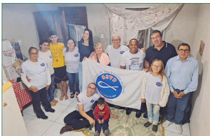
Reconstrução de casa.