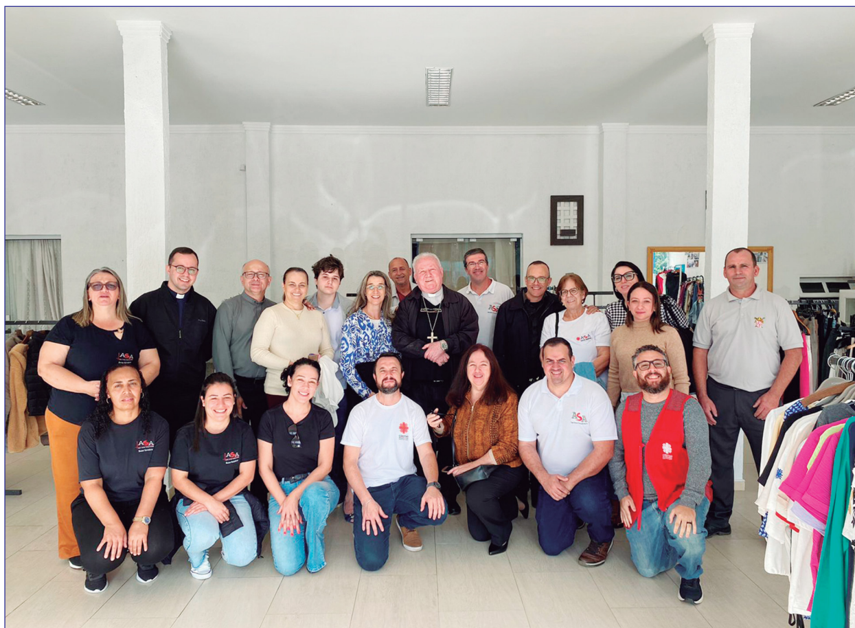
Inauguração Bazar Rio Tavares.

O projeto Bazares Solidários se consolidou em parceria entre Caritas Brasileira Regional/SC e o Instituto Lojas Renner, que realizam mensalmente doação de roupas e acessórios com pequenas avarias. Em 2022, o projeto Bazares Solidários manteve sua atuação, fortalecendo a sustentabilidade financeira da ASA e de entidades sociais que também recebem doações para a realização de bazares, no cumprimento da resolução CNAS 27/2011 que prevê a sistematização e disseminação de projetos inovadores de inclusão cidadã, que possam apresentar soluções alternativas para enfrentamento da pobreza, a serem incorporadas nas políticas públicas.