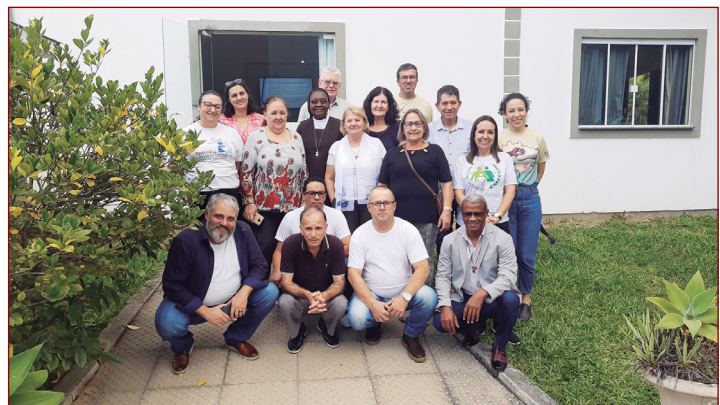
Doutrina Social da Igreja.

Foram prestadas assessoria às ações sociais, entidades e pastorais sociais, por meio de assistência técnica, jurídica, institucional.