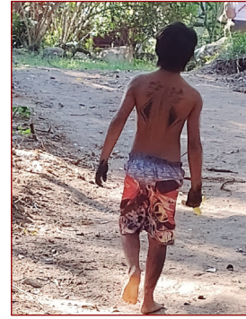
Acompanhamento à Aldeia Indígena.