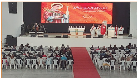
Assembleia Arquidiocesana de Pastoral.