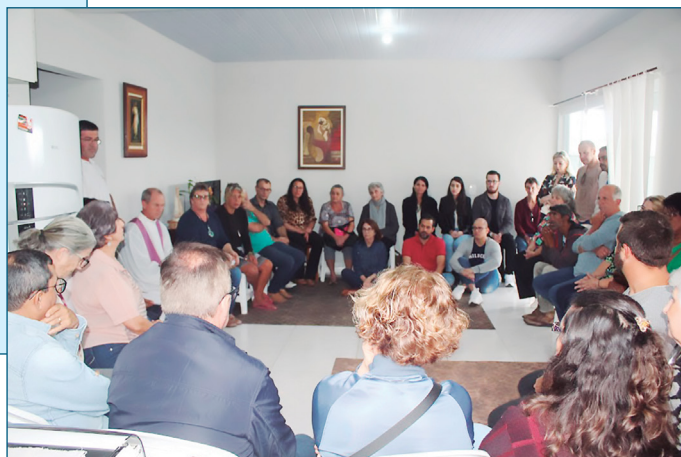
Inauguração Casa Vitória.

Implementar o Programa Moradia Primeiro na Arquidiocese de Florianópolis como uma iniciativa institucional de promoção da dignidade humana e inclusão social, visando oferecer moradia imediata e assistência integral para pessoas em situação de rua na região.