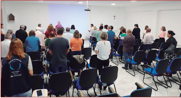
Fórum das Pastorais Sociais.