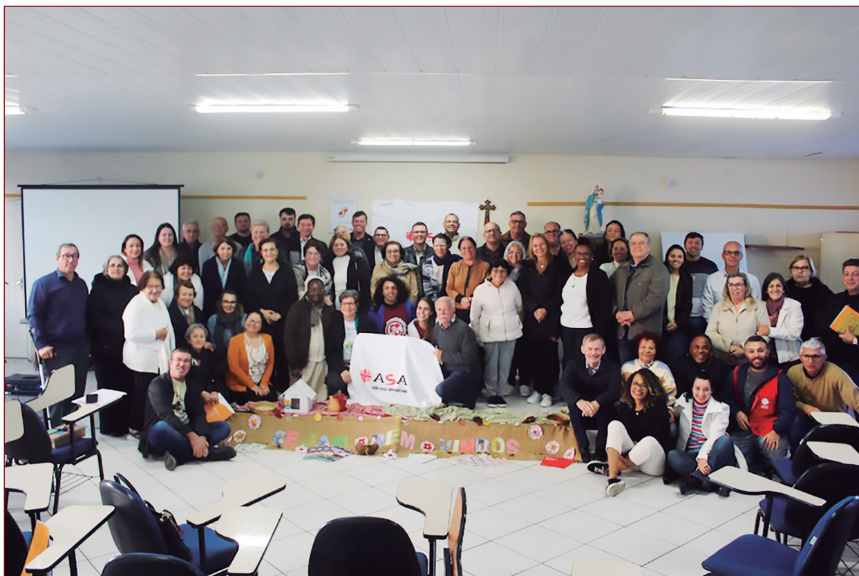
Assembleia da ASA.

Tem prioridade de atendimento às ações Sociais Paroquiais, Entidades Sociais e Pastorais Sociais no território da Arquidiocese de Florianópolis.