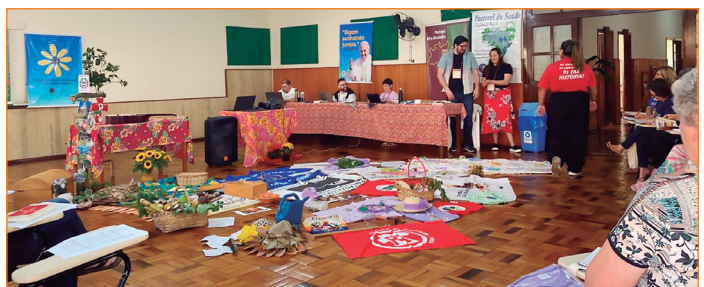
Escola de Fé e Cidadania.