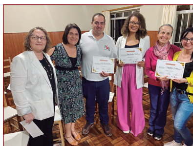
Curso de Formação.