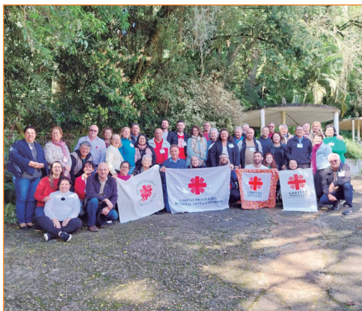
Inter Regional da Cáritas.