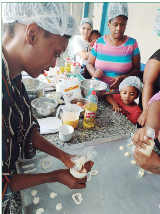
Acima: Cozinha Comunitária. Ao lado: reunião de articulação com o IFSC, sobre Curso de Panificação.