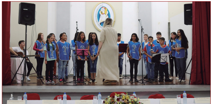
Prêmio Dom Afonso Niehues.

Criado em 1999 composto pelos recursos da Coleta da Solidariedade que acontece anualmente através de campanha realizada pela Conferência Nacional dos Bispos do Brasil (CNBB) o Fundo Arquidiocesano de Solidariedade (FAS), visa apoiar projetos sociais através de abertura de editais como descritos na metodologia. O FAS visa fortalecer e