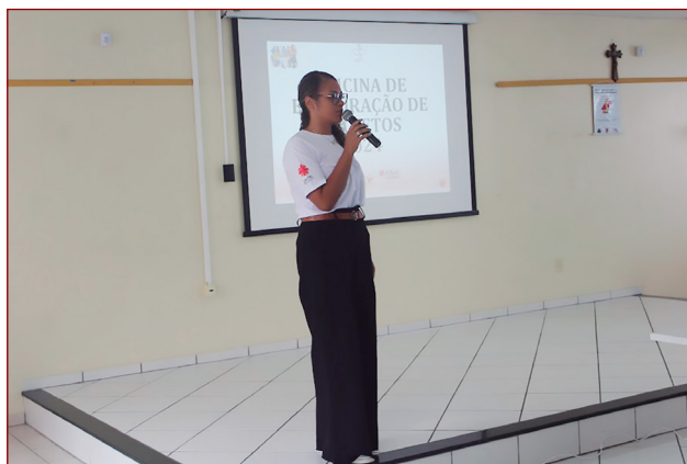
Oficina de Elaboração de Projetos.

qualificar as entidades e organizações quanto ao seu planejamento, captação de recursos, gestão, monitoramento, avaliação, oferta e execução dos serviços, programas, projetos e benefícios sócios assistenciais e para sua atuação na defesa e garantia de direitos, conforme preconizado no CNAS 27/2011. Caracterizando-se como um importante instrumento de transformação social, voltado ao apoio a projetos sociais e de geração de trabalho e renda. É também um organismo do FAS o Prêmio Dom Afonso Niehues. A premiação foi criada no ano de 2013 com a finalidade de reconhecer publicamente os esforços das organizações, associações, entidades, pastorais, grupos populares e pessoas que lutam em defesa e melhoria da vida da população vulnerabilizada.