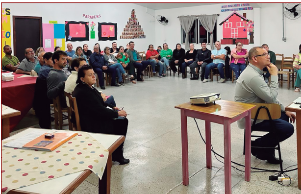
Fundação nova Ação Social, Itajaí.