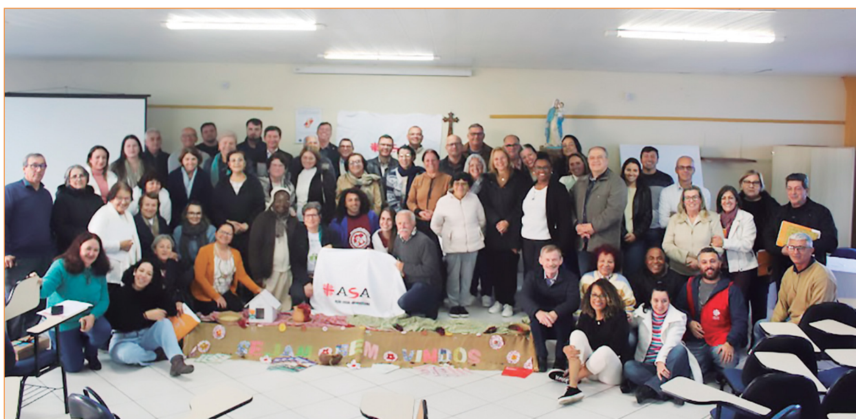
Assembleia da ASA.