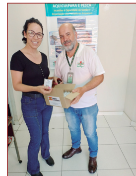
Parceria EPAGRI, doação de sementes.