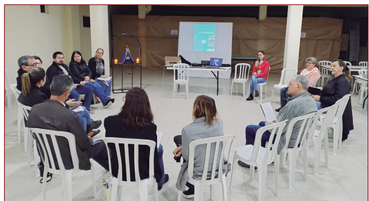
Reunião de Forania.