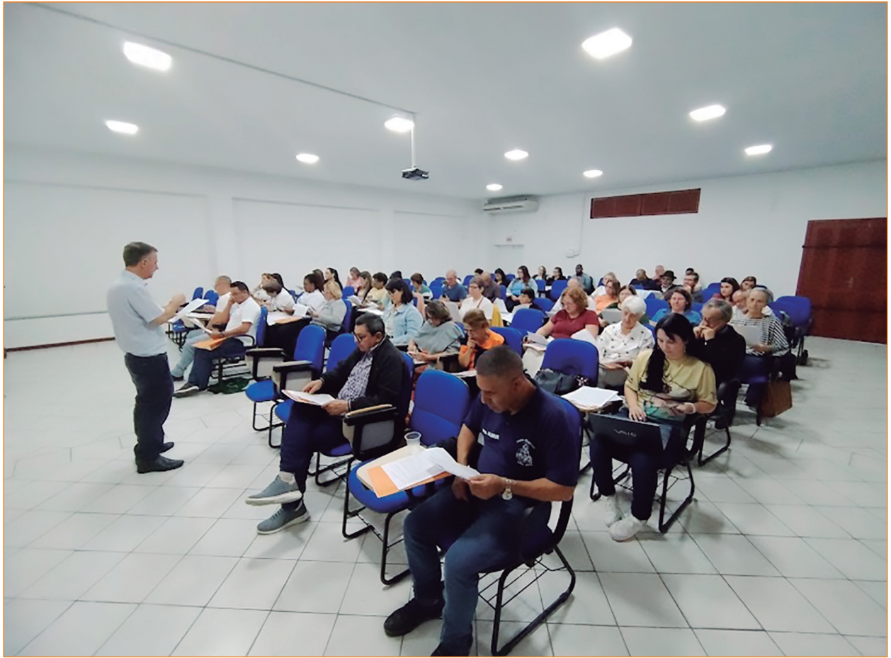
Fórum das Pastorais Sociais.