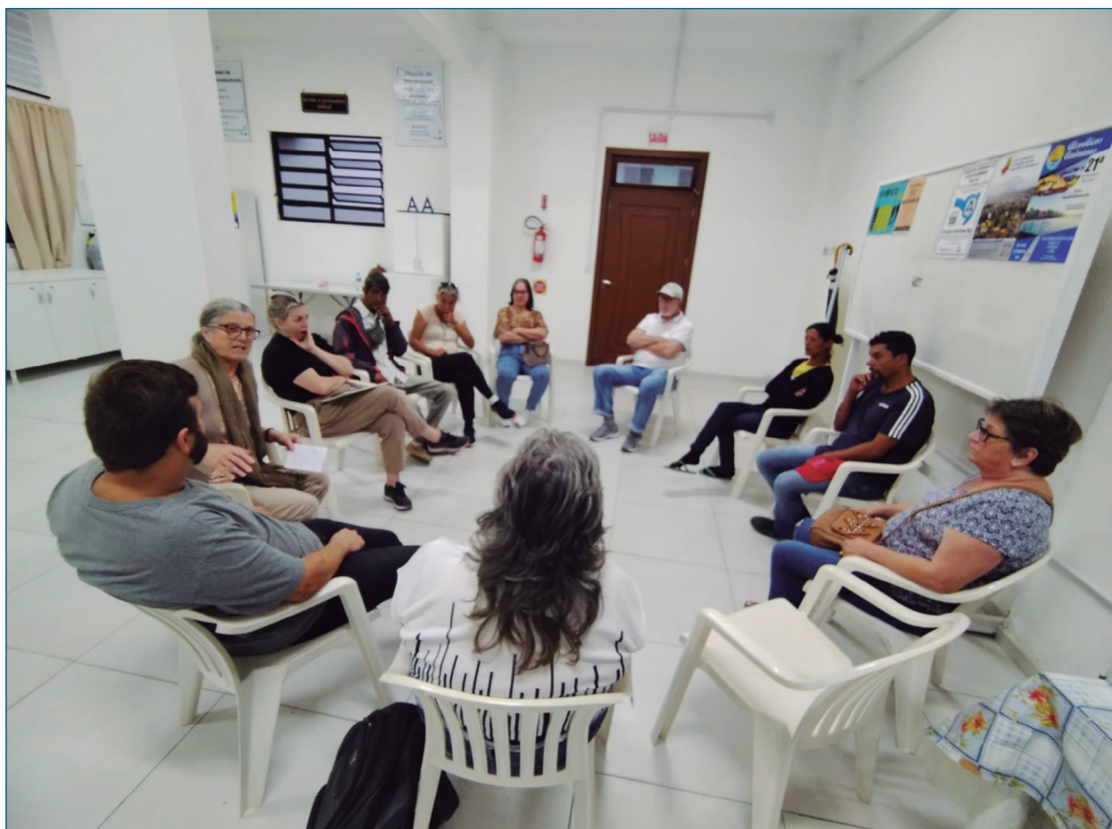
Moradia Primeiro: roda de conversa.

O Programa Moradia Primeiro é uma abordagem inovadora e baseada em evidências para lidar com a questão da falta de moradia crônica. Em vez de exigir que os beneficiários cumpram certos requisitos, como sobriedade ou participação em tratamento para saúde mental ou dependência química, o programa fornece moradia de forma imediata.