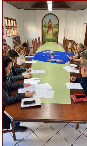
Reunião de Coordenadores Pastorais.