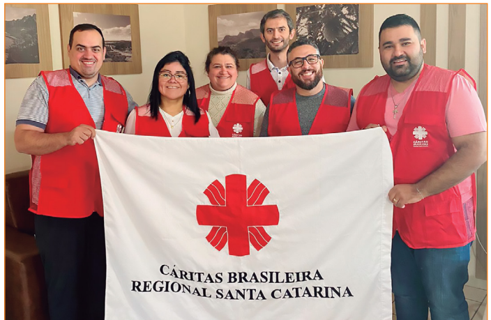
Participação no Conselho Regional da Cáritas.