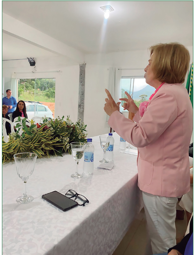
Reunião da Associação de Combate ao Câncer, de Palhoça, no Recanto São Francisco.