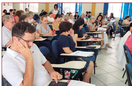
Formação promovida pela ASA.

Tem prioridade de atendimento às ações Sociais Paroquiais, Entidades Sociais e Pastorais Sociais no território da Arquidiocese de Florianópolis.