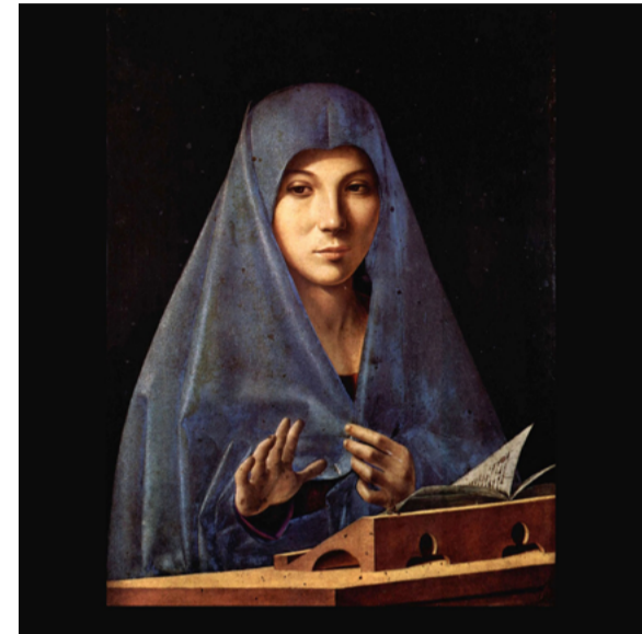
Imagem: A Virgem da anunciação (1474-1476) Antonello da Messina