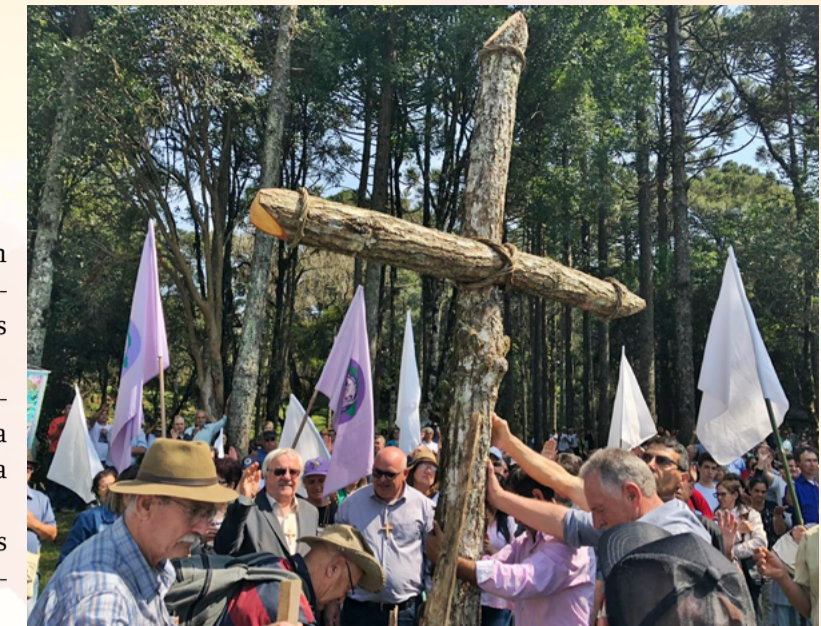
Destacando os momentos-chave da 25ª Romaria da Terra e das Águas, as fotografias capturam a essência e a dinâmica do evento.

A Romaria da Terra e das Águas se apresenta não apenas como um evento religioso, mas como um chamado à ação coletiva, um convite para que todos se tornem peregrinos da esperança, comprometidos com o cuidado e a preservação da nossa Casa Comum.