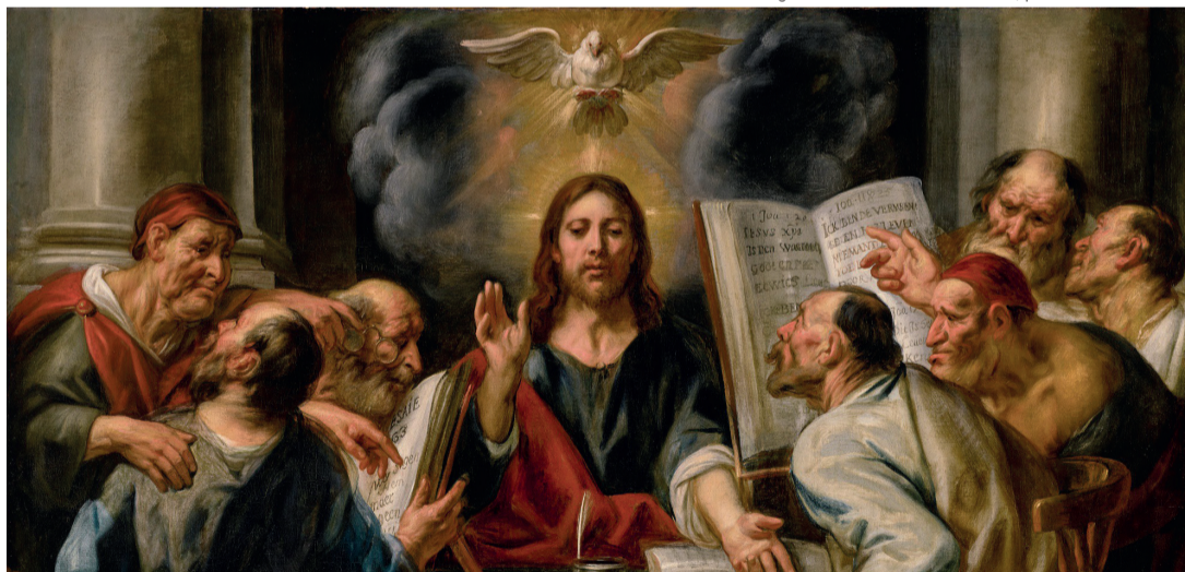
Imagem: Cristo entre os fariseus, por Jacob Jordaens

Após séculos de engajamento político direto na condução da sociedade, por meio da instauração da cristandade, com as consequências obscuras de mundanização de sua ação evangelizadora, a Igreja católica entende que a melhor maneira de exercer a política é voltar a Jesus de Nazaré. Para anunciar com ele e como ele o Reino de Deus. Por isso, pede a seus ministros ordenados (bispos, padres e diáconos) que não façam opção partidária, para não serem sinais de divisão no meio do povo. E pede aos cristãos leigos que se engajem na política partidária, a fim de atuar na proposição e na prática de políticas públicas em favor de melhores condições de vida para o povo. Políticas públicas que sejam sinais do Reino de Deus.